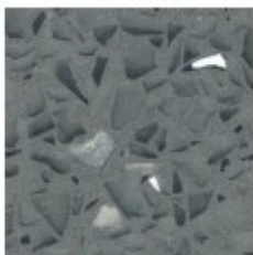
Mondeco Crystal Ice Dusty Grey