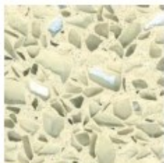
Mondeco Crystal Ice Oyster White

(Si tiene cualquier tipo de duda de como adquirir estos elementos o cualquier otro contacte con nuestro departamento técnico)