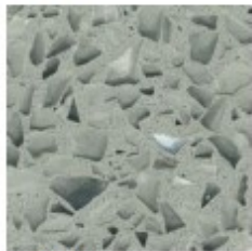
Mondeco Crystal Ice Agate Grey