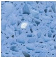
Mondeco Crystal Ice Provence Blue